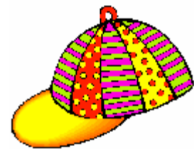
Une casquette .....